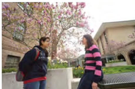
约翰霍金斯大学皮博迪音乐学院