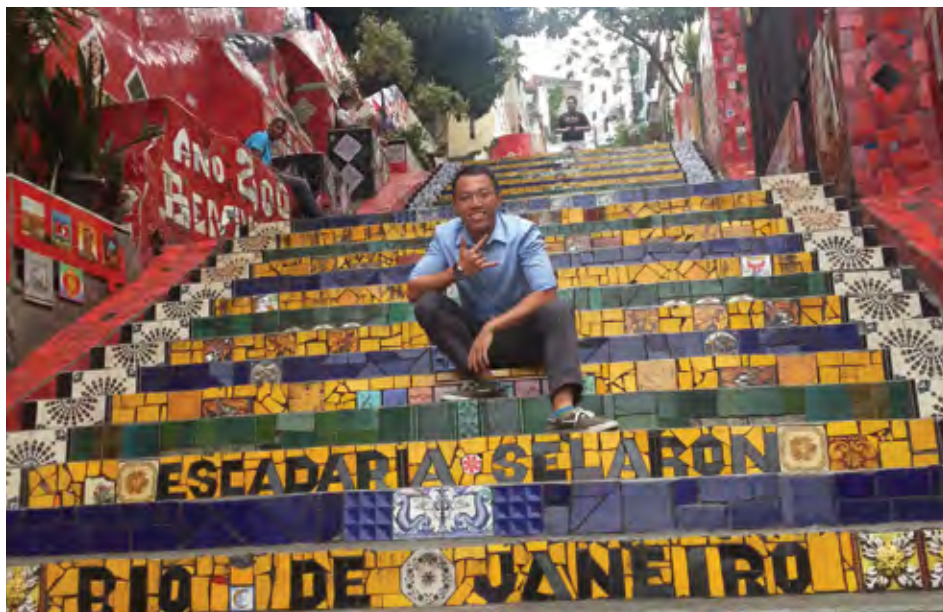
国大推出“联系与增广学习之旅”计划，让学生熟悉新兴市场的社会文化经济环境

国大推出一系列特别寄宿型学院计划，为学生提供校园内寄宿生活体验， 让生活与学习社群 能以更有意义的方式同生共息、生气盎然。我们也借助科技，设计了内容广泛的 混成式学习课程 ，让面对面交流学习体验与线上学习模式相结合，彻底改变学生在校园内外的学习方式。