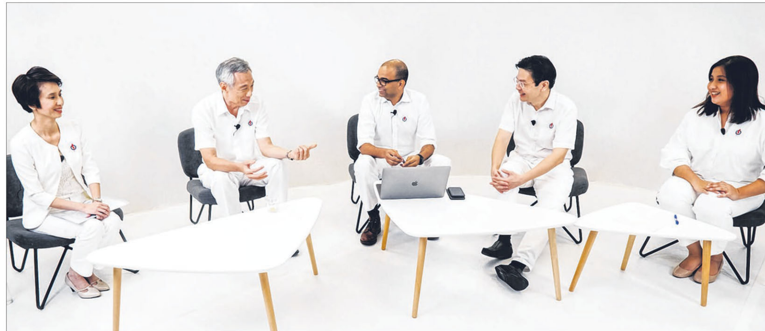
调查发现，有64%选民认为线上群众大会对他们的投票选择发挥了作用。图为今年大选中李显龙总理（左二）与当时的人民行动党候选人刘燕玲（左起）、普杰立、黄循财和新面孔娜蒂雅一起出席线上群众大会。（档案照片）