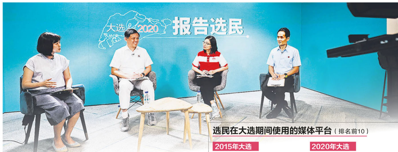
▲新加坡报业控股华文媒体集团新闻中心在大选期间，每天傍晚播出面簿直播节目《报告选民》。（档案照片）