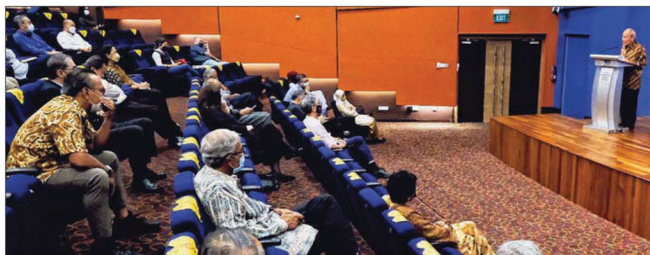
KHUSYUK DENGAR PENCERAHAN: Kuliah Profesor Wang Gungwu dianjurkan Jabatan Pengajian Melayu, Fakulti Sastera dan Sains Kemasyarakatan, Universiti Nasional Singapura (NUS).

"Beliau bimbang misi pemeradaban yang dibina ke dalam model negara bangsa (nation state) menyebabkan kita menerima hasil keilmuan Barat tanpa mempersoalkan imperialisme di sebaliknya."