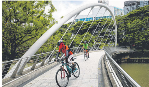
横跨新加坡河的若锦桥。(档案照片)

职员、英国军队、印度籍驻兵(sepoy)、警务人员；居民患病时，唯有求于中医或土医。