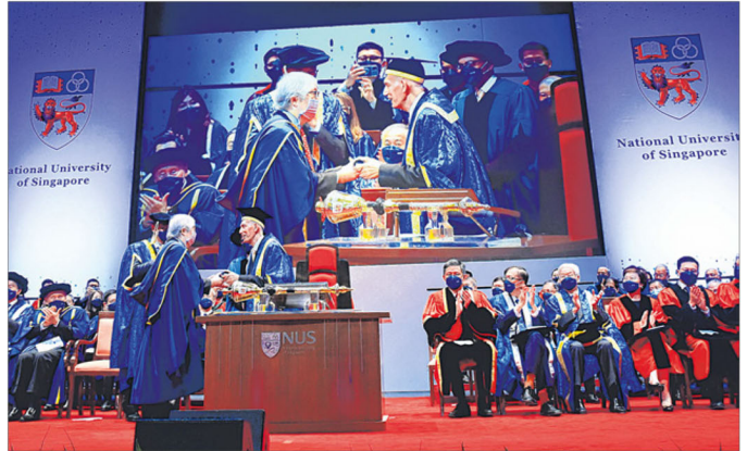
我国巡回大使许通美教授（左站立者）昨天在国大首场毕业典礼上，从国大名誉副校长布奥（Po'ad Mattar）手中接过名誉法学博士学位。

国大今年共有1万3975名毕业生，当中7571人获得学士学位，另6404名获得研究生学位。昨天首场毕业典礼上，约200名文学暨社会科学院毕业生获颁学位文凭。出席活动的嘉宾包括教育部长陈振声。