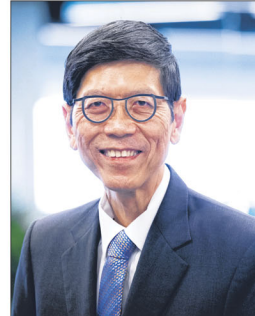
PROFESOR TAN CHORH CHUAN: Ketua Saintis Kesihatan di Kementerian Kesihatan (MOH).

Seramai 67 individu pula menerima Bintang Bakti Masyarakat, yang dianugerahkan kepada individu yang memberikan perkhidmatan awam yang berharga kepada rakyat Singapura, atau yang unggul dalam bidang seni dan persuratan, sukan, sains, perniagaan, profesion dan gerakan pekerja.