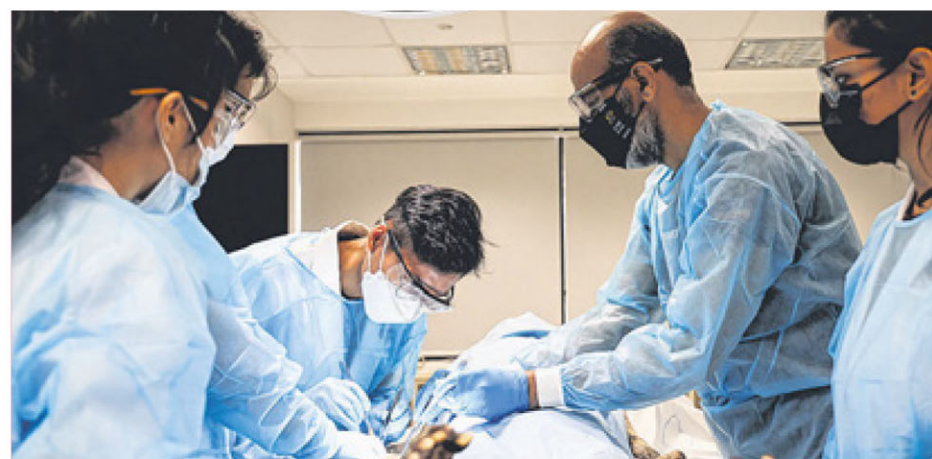
为提高国人对遗体捐献的意识，杨潞龄医学院在2012年推出“无语良师”计划。

为提高国人对遗体捐献的意识，杨潞龄医学院在2012年推出“无语良师”计划（Silent Mentor Programme）。这项计划今年迈入第10年，截至8月23日，共接收到174具遗体，当中106个男性，68个女性，年龄介于38岁至98岁。这些遗体捐献者都是生前向NOTU注册，死后由家属送交国大医学院作为教学用