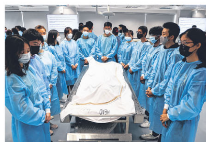
片刻的禁语，永恒的敬语。谢谢您，老师！