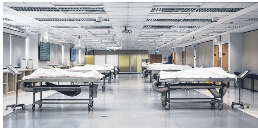
国大杨潞龄医学院人体解剖教学中心课堂里，八位老师静候学生，这一等，已是死后的两三年。