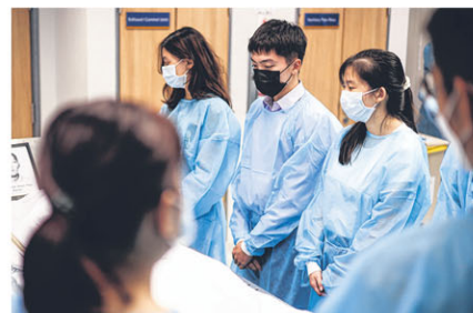
端视眼前遗照，仿佛穿越时空，明白了“无语良师”生前的最后一个愿望。

每个医学生都经历过这门与人体对话的课，他们称作解剖课——解开与剖析大体。事实上，并不是每个学生都能在一具完整的人体上动刀，多数使用分解后的区块，从中习得知识。毕竟，最困难的是，大体何来？新加坡国立大学杨潞龄医学院2012年推出遗体捐献计划后，国人可在生前签署遗体捐献协议书，决定死后将遗体让医学生初窥人体堂奥。因着这股勇敢与大无畏的举动，这些遗体被称为“无语良师”。他们不发一语，却是一位滋养学生的好老师；他们不带走一物，却留下满身的奥秘与知识。