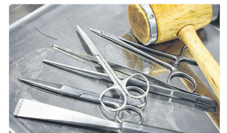
学生用锤子、手术刀、手术剪、手术镊在老师身上任意游走，但老师从不动怒。