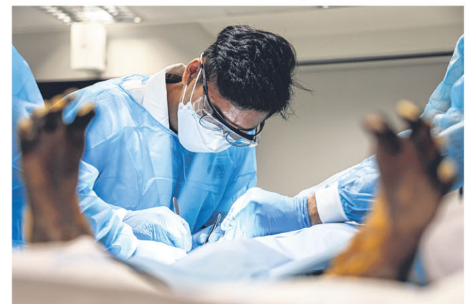
请在我身上划上错误的千百刀，也别在病人身上错划一刀。