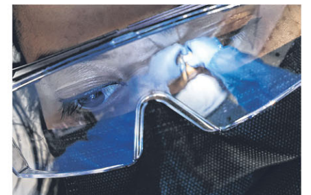
第一次的照面，我已离开这世界；但请不要害怕，我活着时很善良、很亲切。