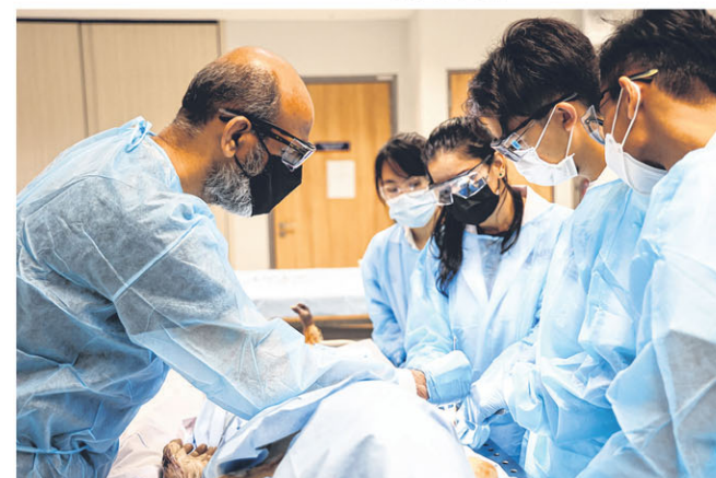
以一人之闭眼，为众人开眼。教授以“无语良师”为课本，细心亲授人体解剖学。