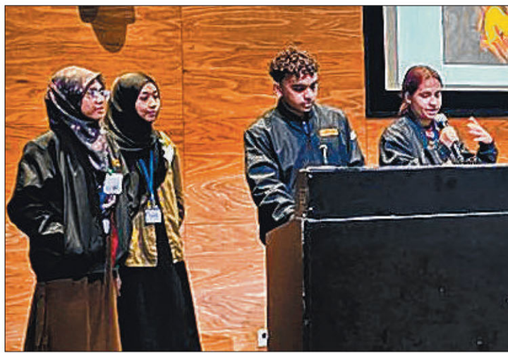
Pasukan Careviz membentangkan pandangan bernas mereka sewaktu acara 'Hackathon Belia', yang merupakan bahagian penting Persidangan Antarabangsa mengenai Komuniti yang Berjaya (ICCOS) 2024

Pemeriksaan Sosial; Kespadaan Sosial untuk Masa Depan; Kepimpinan Perwakilan; dan Pertimbangan untuk Masa Depan: Perusahaan, Profesional dan Sektor Agama.