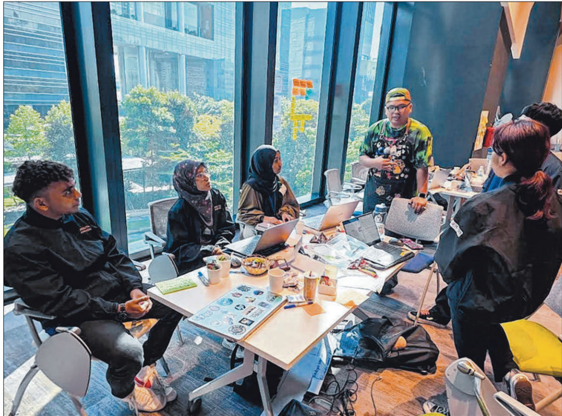
Peserta membincangkan dan melontarkan idea baru dalam mencari penyelesaian masalah yang membelenggu masyarakat dalam acara 'Hackathon Belia'.

Peserta perlu menangani isu dunia sebenar merentas empat domain utama: Peningkatan dan