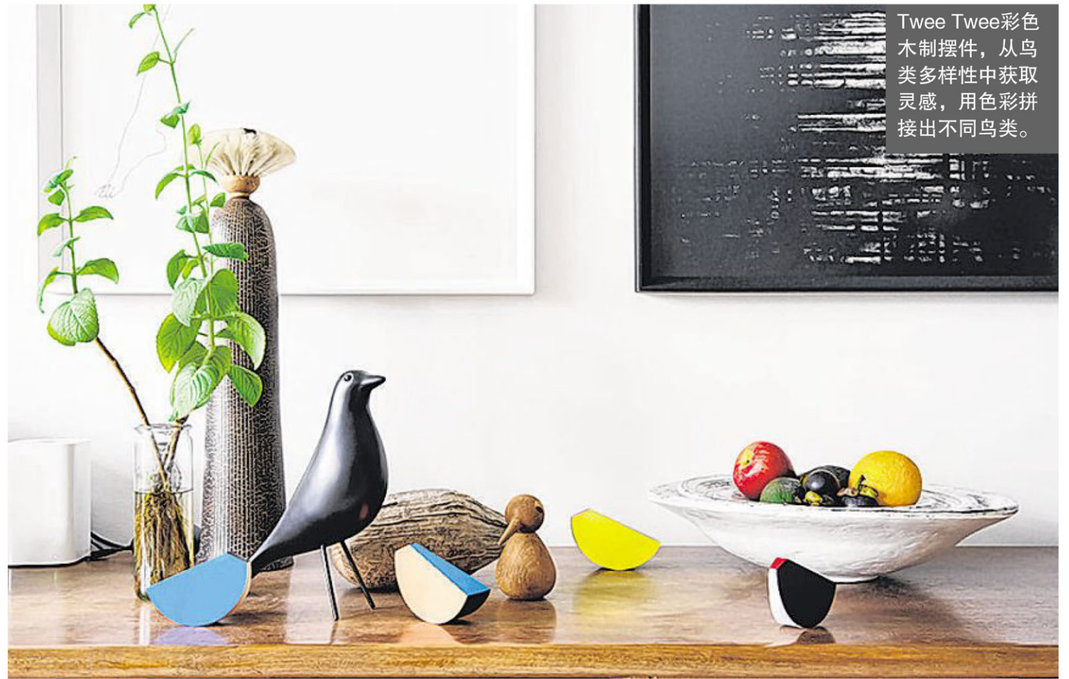
Twee Twee彩色木制摆件，从鸟类多样性中获取灵感，用色彩拼接出不同鸟类。