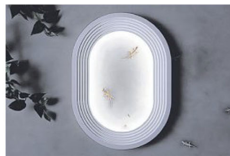
Harena以壁虎来打造自然景观。

花是植物界最缤纷的代表，看花赏花皆是赏心悦目的美学体验。“In Praise of Flowers”系列将艺术美学融入赏花的过程，做出适合不同花卉形态的装饰品。以九种本地常见花卉，牡丹、薰衣草、绣球花、胡姬