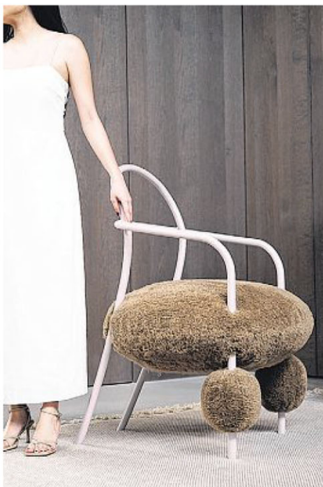
座椅系列讽刺饲主给宠物狗美容的做法。