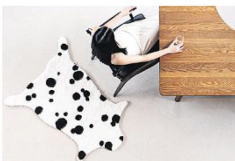
狗毛制成的兽皮形状地毯。