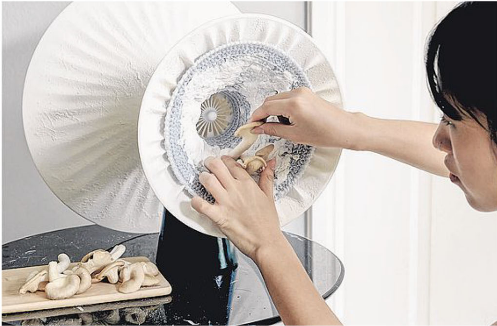
Celia真菌空气过滤器利用从杏鲍菇中提取的活菌丝，形成过滤网。

名为Celia的真菌空气过滤器，完美诠释了菌丝体的可循环生命周期。装置本身由菌丝体制成，在纱锥上放入从杏鲍菇中提取的活菌丝，就像空气过滤网一样，可以净化空气中的污染物。一旦菌丝耗尽，可替换一批新菌丝，旧菌丝则被回收用作3D打印材质，形成永续循环。