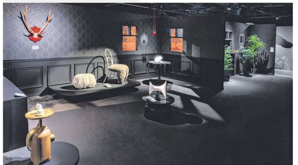
“The Nature of Things” 设计展以一窗之隔，分设出住家里外两个场域。

票价：成人$17；儿童、学生、乐龄、服役者$9（详情参见博物馆官网lknhm.nus.edu.sg）