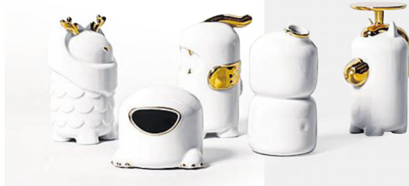
极简物系列的现代风水五件套。

底挖出珊瑚做成饰品，被物化的美始终不敌浸泡在水中时，自然栖息状态下的美感。从水中取出后，珊瑚是无光泽的水晶骨架，只有被浸没在水中，才能展现出自然赋予的真色彩。