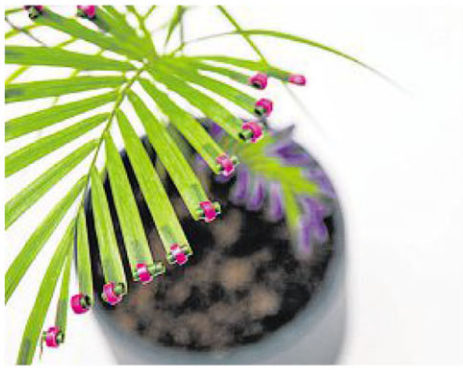
用植物夹点缀盆栽，为家居添色彩。

人与自然的联系，是城市发展进程中绕不开的话题。日前在李光前自然历史博物馆（Lee Kong Chian Natural History Museum）举行的“The Nature of Things”设计展，由新加坡国立大学工业设计系学生从设计视角出发，重新审视城市生活中的自然景观。或展现自然之美，或抛出引人沉思的思索。