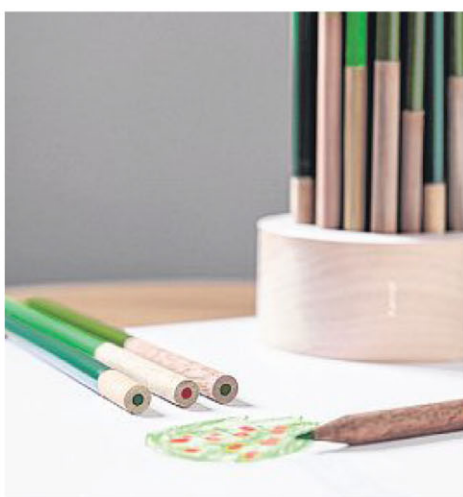
Kanopi彩色铅笔以本地树木制成。