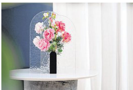
用波浪纹路玻璃呈现印象派画风般的透视效果。