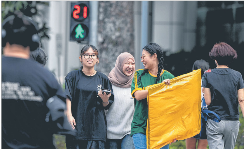
本地调查显示，约79.1%受访者认为自己未曾受到工作或升职相关的种族歧视，相比2018年的68.3%有所改善。

受到职场歧视的人当中，多达57.7%反映他人在工作中使用其他语言交谈，使自己被排除在外；也有34.2%觉得自己的种族背景导致机会更少。