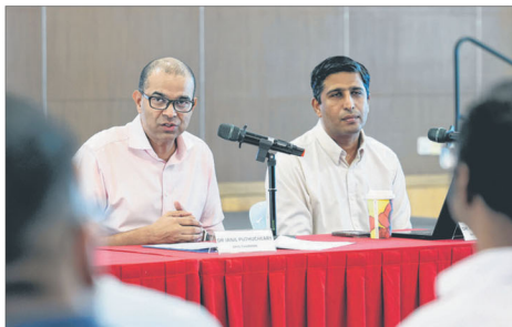
数码发展及新闻部兼卫生部高级政务部长普杰立医生（左）2月3日，以种族和谐资源中心主席身份出席种族与宗教和谐指标调查报告发布会，并在会后回应有关集选区制度的提问。新加坡政策研究所社会研究室主管兼首席研究员马修博士（右）也出席发布会。

升职相关的歧视较多来自受访者在公司观察到的趋势，包括有其他种族晋升是基于种族背景而不是资格（47.7%），以及位居高职的同事通常是其他种族（42.6%）。