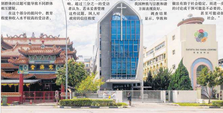
新一轮《新加坡的断层线：以种族和宗教为焦点的观念和管理》调查报告显示，近半受访者认为种族和宗教议题若处理不当，可能激起人们对某些族群的愤怒情绪。

研究团队指出，年长者，尤其是作为大多数的华族社群年长者，经历过我国早期的建国和经济发展过程，并且感受了历届政府为维持社会凝聚力付出的努力，这可能会增强他们对现有制度的信任。“他们的满足感可能反映出一种观念，即政府当前的做法有助于社会稳定，而进一步的讨论或干预可能是不必要的，甚至可能动摇社会。”