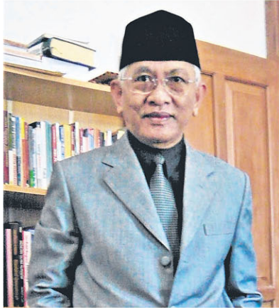
Kiai Ahmad Mustofa Bisri, atau lebih akrab dipanggil Gus Mus banyak menulis karya sastera dan ilmiah. Dalam mengiktiraf sumbangan ilmu dan budaya, beliau diberikan gelaran Doktor Honoris Causa oleh Universiti Islam Negeri (UIN) Sunan Kalijaga di Yogyakarta.

Beliau juga menulis prosa pendek berupa cerita telah